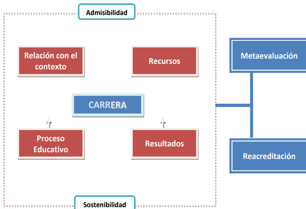
Figura No. 1. Dimensiones del modelo de acreditación del SINAES para carreras de grado

Dentro del modelo de evaluación del SINAES, los elementos representados en la figura 1 se entienden de la siguiente manera: