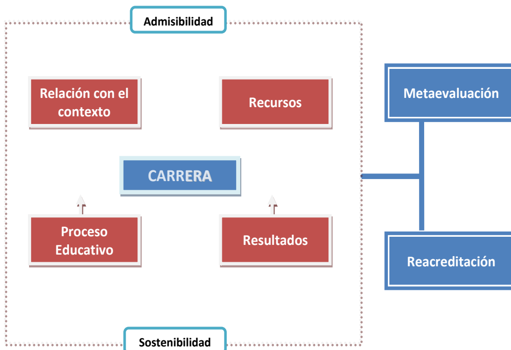
Figura No. 2. Dimensiones del modelo de acreditación del SINAES para carreras de grado

Adicionalmente a las dimensiones, el modelo del SINAES establece cuatro elementos que complementan la evaluación, éstos son los criterios de admisibilidad, los criterios de sostenibilidad de la acreditación y mejoramiento de la carrera y las orientaciones para realizar la metaevaluación y la reacreditación.