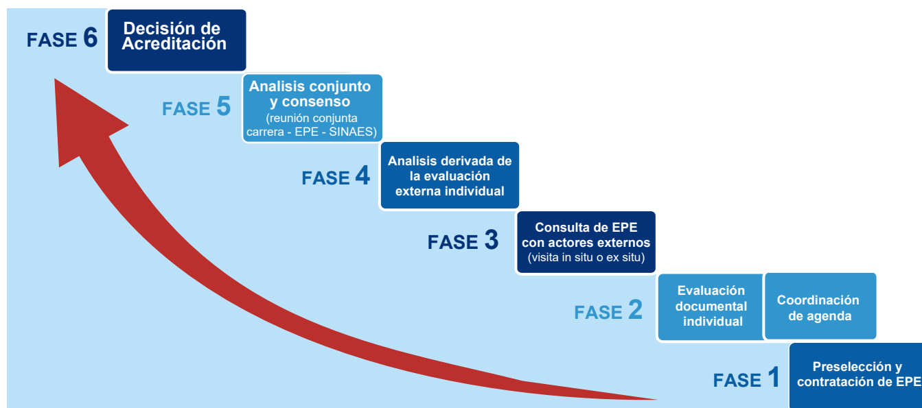
Figura 2. Fases de la etapa de evaluación externa

Esta etapa de la acreditación atraviesa seis fases; tal y como se observa en la Figura 2.