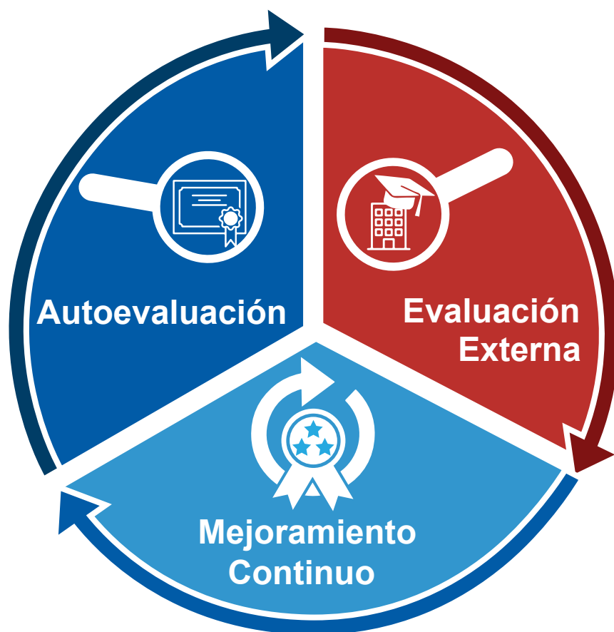
Figura 1. Etapas del proceso de acreditación del SINAES

El detalle de las etapas del proceso de acreditación se presenta en los apartados siguientes de esta guía.