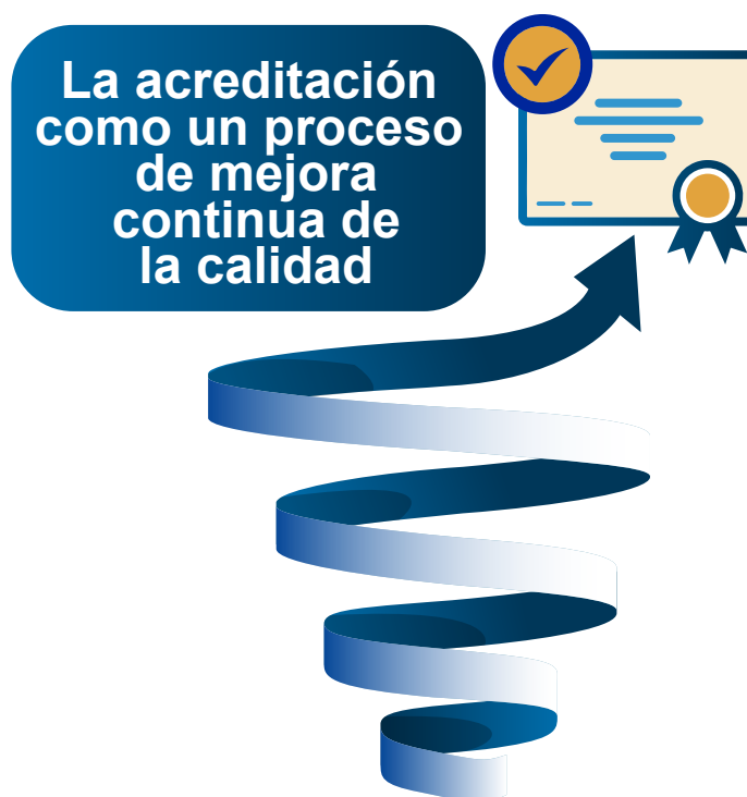
Figura 4. La progresividad del proceso de calidad

En este sentido, la reacreditación es necesaria y fundamental, para asegurar que las carreras de educación superior mantienen y fortalecen, de manera continua, la calidad alcanzada en el ciclo anterior. Realizar el proceso de reacreditación permite verificar que la carrera no solo ha sostenido sus fortalezas y superado las debilidades previamente identificadas, sino que también ha evolucionado y respondido a las nuevas demandas del entorno académico, social y laboral.