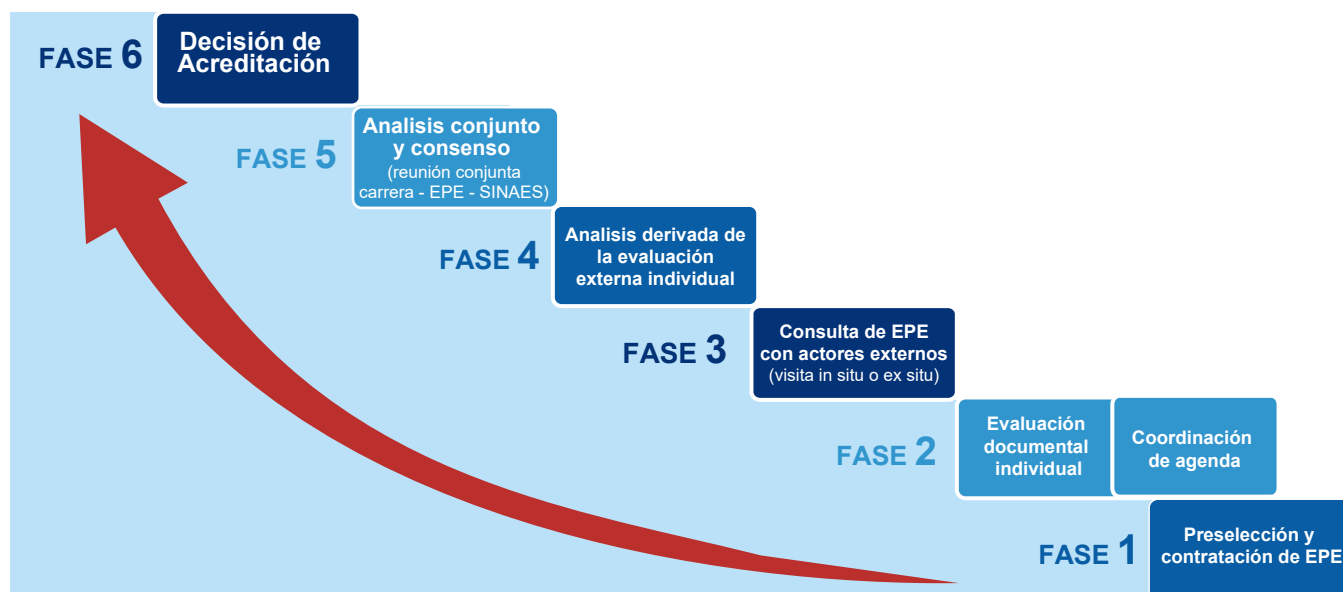
Figura 2. Fases de la etapa de evaluación externa

Esta etapa de la acreditación atraviesa seis fases; tal y como se observa en la Figura 2.